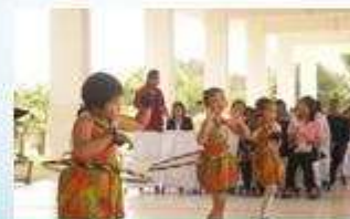
ศวดศุพธรรมา