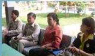
รอง นพ. ศศอ. อำนาจเจริญ ไฟการสยหรับ

วันที่ 7-8 มีนาคม 2554 นางปณิตดา จันทร์่อง ตัวแทนกรมอนามัยและคณะ ออกเยี่ยมประเมินโรงเรียนส่งเสริมสุขภาพระดับเพชร ในระดับกระทรวงได้แก่