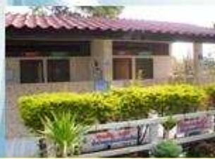
ห้องสุธาโรงเรียนมหาตรฐาน HAS

โรงเรียนหนองแห่โนนสมบูรณ์ ตั้งอยู่ ตำบลนายาม อำเภอเมือง จังหวัดอำนาจเจริญ โรงเรียนคุณภาพ ระดับประถมศึกษาที่มีกระบวนการในการดำเนินงาน โรงเรียนส่งเสริมสุขภาพได้อย่างมีระบบ ภายใต้การให้ การสนับสนุนจากสำนักงานสาธารณสุขจังหวัดและ เครือข่ายหลากหลายในพื้นที่ มีจุดเด่นอยู่ที่กิจกรรม การออกกำลังกายเป็นกิจวัตร พร้อมกับการจัด สิ่งแวดล้อมที่เอื้อต่อการมีสุขภาพภายใต้หลักการของ เศรษฐกิจพอเพียง ทำให้โรงเรียนสามารถพึ่งพาตนเอง ได้ในทุกสถานการณ์