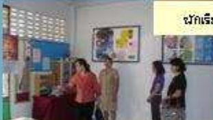
เขือพองการดำเนินงานในโรงเรียน