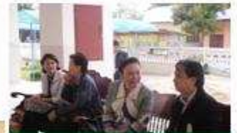
รอง นพ. ศศอ. แดงนชัยเขตมนตรี ไฟการสยหรับ

โรงเรียนหนองแห่โนนสมบูรณ์ ตั้งอยู่ ตำบลนายาม อำเภอเมือง จังหวัดอำนาจเจริญ โรงเรียนคุณภาพ ระดับประถมศึกษาที่มีกระบวนการในการดำเนินงาน โรงเรียนส่งเสริมสุขภาพได้อย่างมีระบบ ภายใต้การให้ การสนับสนุนจากสำนักงานสาธารณสุขจังหวัดและ เครือข่ายหลากหลายในพื้นที่ มีจุดเด่นอยู่ที่กิจกรรม การออกกำลังกายเป็นกิจวัตร พร้อมกับการจัด สิ่งแวดล้อมที่เอื้อต่อการมีสุขภาพภายใต้หลักการของ เศรษฐกิจพอเพียง ทำให้โรงเรียนสามารถพึ่งพาตนเอง ได้ในทุกสถานการณ์