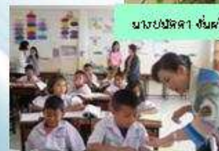
ตรวจเขือพองนักเรียนในชั้นเรียน

โรงเรียนเทศบาล 1 กุดชุมคूरราชภูร์บำรุง สังกัด เทศบาลตำบลกุดชุมพัฒนา อำเภอกุดชุม จังหวัด ยโสธร โรงเรียนคุณภาพภายใต้การพัฒนาของ นายกเทศมนตรีและผู้อำนวยการที่มุ่งพัฒนาคนไป พร้อมกับการมีสุขภาพที่ดี พร้อมทั้งเสียงที่เข้มแข็งจาก สำนักงานสาธารณสุขจังหวัด มีกระบวนการเรียนการ สอนที่สร้างความรู้เพื่อการนำไปสู่สุขภาพดีของนักเรียน และชุมชน