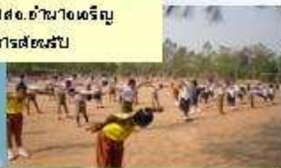
นักเรียนออกก่าสงกายตอนเช้า