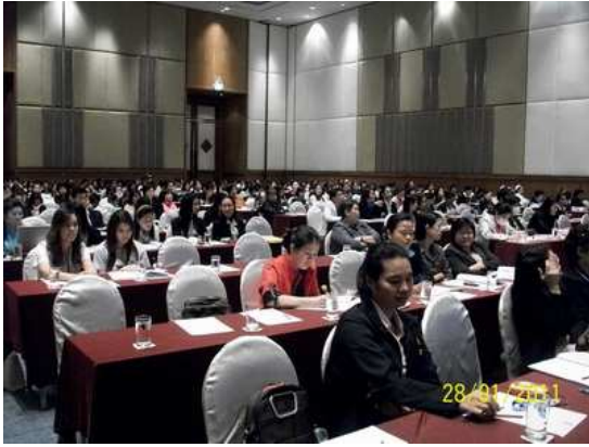
บรรยากาศภายในห้องประชุม