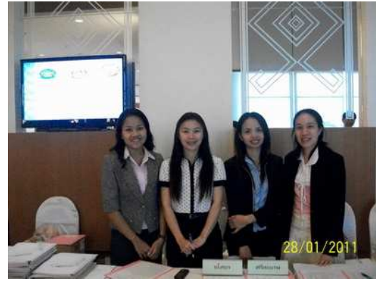
ทีมต้อนรับและลงทะเบียนจากศูนย์อนามัยที่ 7 อุบลราชธานี