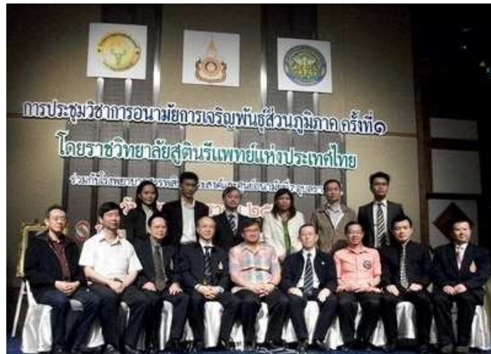
นายแพทย์สาธารณสุขจังหวัดอุบลราชธานี ผู้บริหารจากศูนย์อนามัยที่ 7 อุบลราชธานีและ โรงพยาบาลสรรพสิทธิประสงค์ ร่วมถ่ายภาพกับวิทยากรจากราชวิทยาลัยสูตินรีแพทย์แห่งประเทศไทย