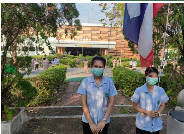
การเคารพธงชาติ