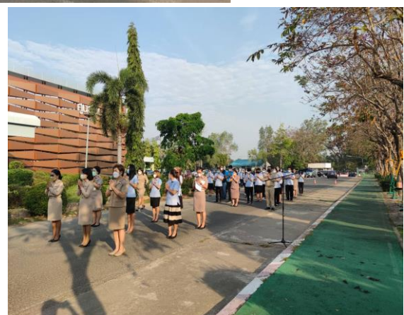
การสวดมนต์ไหว้พระ